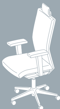
Kopfstütze und Armlehnen optional